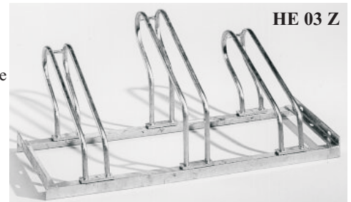
HE 03 Z