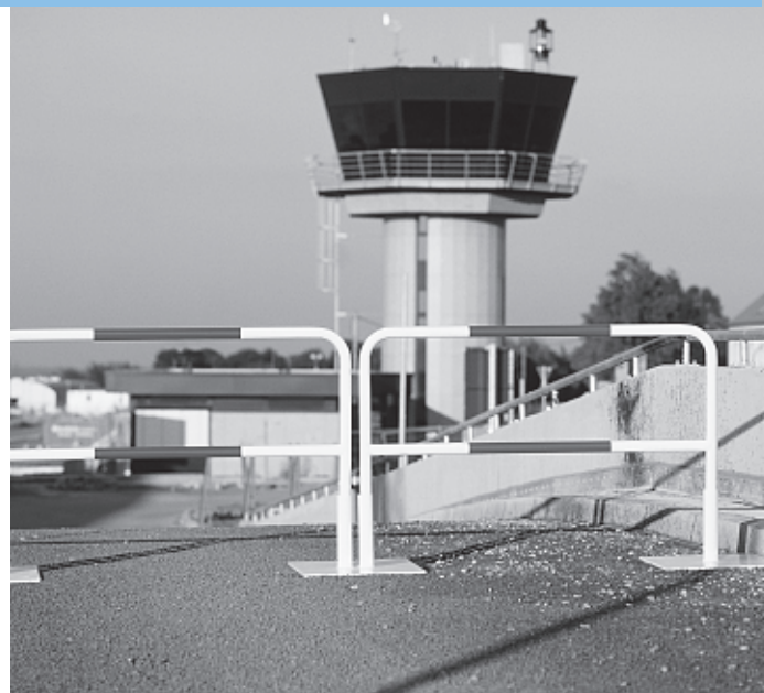
Sperrzaun SZ aus Stahl, feuerverzinkt Höhe über Flur 1000 mm